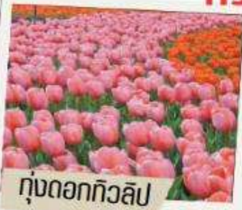
ทุ่งดอกทิวลิป