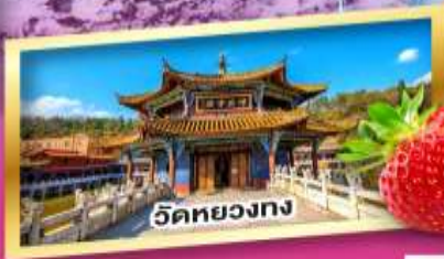
วัดหยวงทง