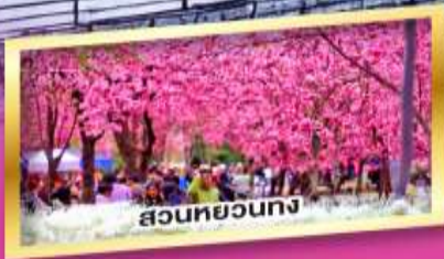
สวนหยวงทง