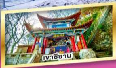
เวาชีซาบ