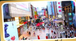
ช้อปปิ้งถนนชุนชิว