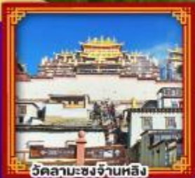
วัดลามะซงจ่านหลิง