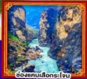
ช่องแคบเสื่อกรโง