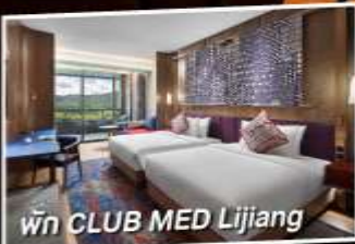
พัก CLUB MED Lijiang