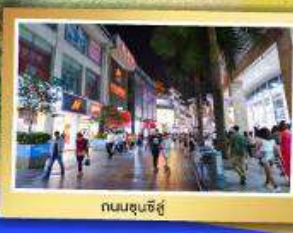
ถนนชุนชี่งู๋