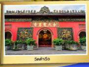
วัดต้าเวี๋