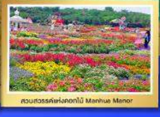
สวนสวรรค์แห่งดอกไม้ Manhuo Manor