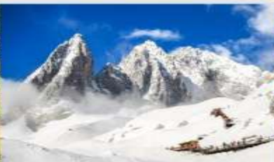
ภูเขาหิมะมิงกรหยก