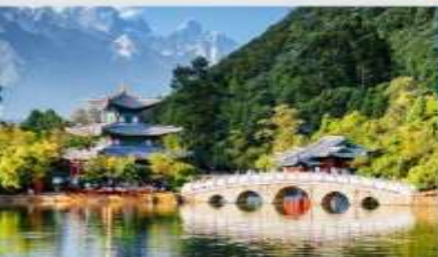
สระมิงกรดำ