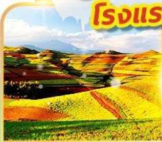
แผ่นดินสีแดงตงชวน