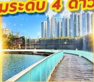
สวนน้ำตกคุณหมิง