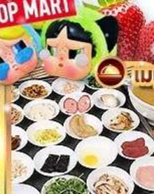
ขนมจีนข้ามสะพาน