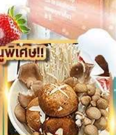
สุกี้เห็ด