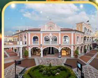
ช้อปปิ้ง FLORENTIA VILLAGE OUTLET