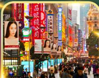
เดินเล่นถนนหนานจิง