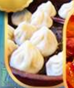
เสี่ยวหลงเปา