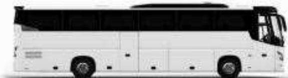
รถนำผู้โดยสาร 1 คัน

ค่าที่พักตามที่ระบุในรายการหรือเทียบเท่าระดับเดียวกัน (พักห้องละ 2 ท่าน) หากประเภทห้องพักท่านมีความต้องการ เช่น อาหารเช้าเพิ่มเป็น TWIN BED หรือ DOUBLE BED ท่านมีสิทธิขอสงวนสิทธิ์ในการปรับประเภทห้องพัก เป็นตามที่โรงแรมมีอยู่ โดยไม่ต้องขอแจ้งให้ทราบล่วงหน้า