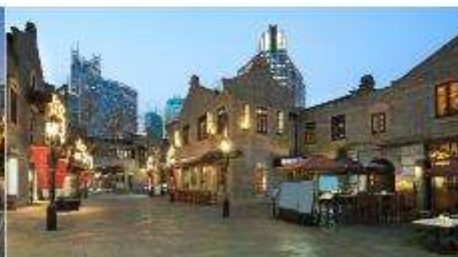
ย่านซินเทียนตี้