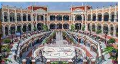
Florentia Village Outlet

*ทางบริษัทฯ ขอสงวนสิทธิ์ในการสลับโปรแกรมทัวร์ตามความเหมาะสมขึ้นอยู่กับสถานการณ์หน้างาน โดยค่านี้จึงแสดงผลประโยชน์ของลูกค้าเป็นสำคัญ