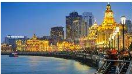
หาดไว่ทาน