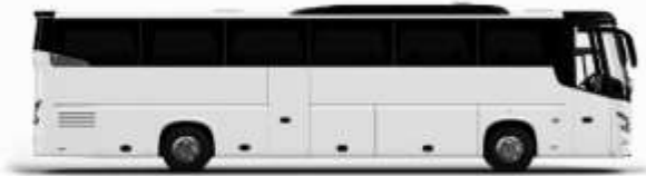
ตัวอย่างรถโดยสาร 1 คัน

ค่าที่พักตามที่ระบุในรายการหรือเทียบเท่าระดับเดียวกัน (พักห้องละ 2 ท่าน) หากประเทศห้องที่ท่านริเวสณาเดิม อาทิ เช่น ริเวสห้องพักเป็น TWIN BED หรือ DOUBLE BED ทางบริษัทขอสงวนสิทธิ์ในการปรับประเภทห้องพัก เป็นตามที่โรงแรมมีอยู่ โดยไม่ต้องแจ้งให้ทราบล่วงหน้า