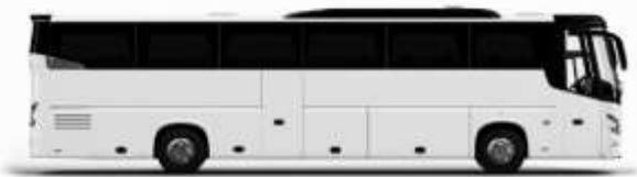
ตัวอย่างรถพลาท 1 ชั้น

ค่าที่พักตามที่ระบุในรายการหรือเทียบเท่าระดับเดียวกัน (พักห้องละ 2 ท่าน) หากประเภทห้องที่ท่านริเวสณาเข้ามาอีก เช่น ริเวสคองพักเป็น TWIN BED หรือ DOUBLE BED ทางบริษัทของสงวนสิทธิ์ในการปรับประเภทห้องพัก เป็นตามที่โรงแรมมีอยู่ โดยไม่ต้องแจ้งให้ทราบล่วงหน้า