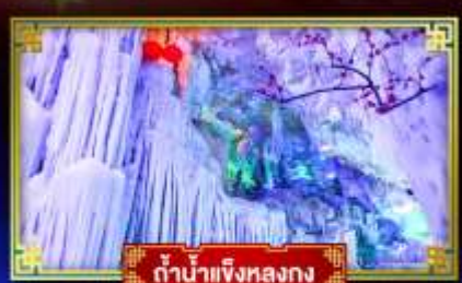
ตำนานเงี้ยวหลงกวง

"เที่ยว 2 มณฑล กวางซี-กัชโจว" สุดอลังการ น้ำตก 2 พรมแดน แหล่งท่องเที่ยวระดับ 5A