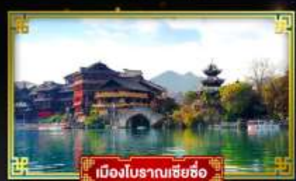
เมืองโบราณเซี่ยซือ