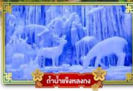
ตำนานแห่งหลงกง