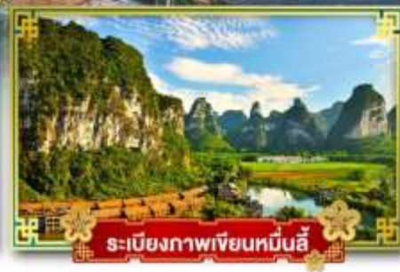
ระเบียงภาพเขียนหมิ่นลี่