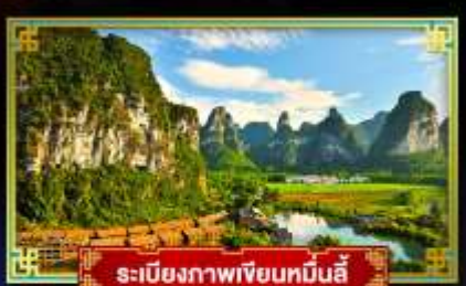
ระเบียบภาพเขียนหมิงฮี้