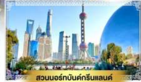
สวนนอร์ธบิ้นด์กรีนแลนด์