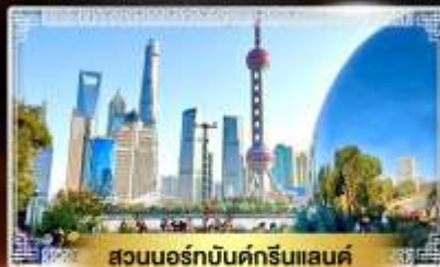
สวนนอร์มัลด์กรีนแลนด์