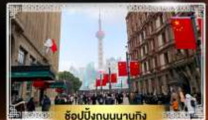
ช้อปปิ้งถนนนานกิง