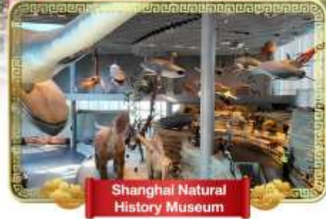
Shanghai Natural History Museum