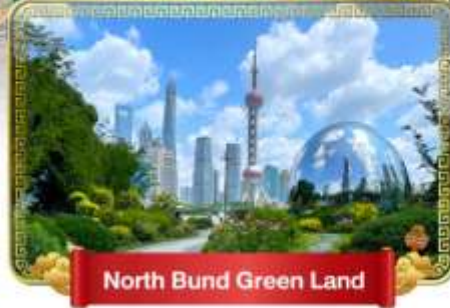
North Bund Green Land