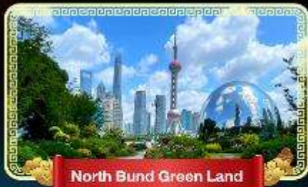
North Bund Green Land