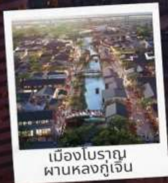
เมืองโบราณ ผานหลงกุเจิน