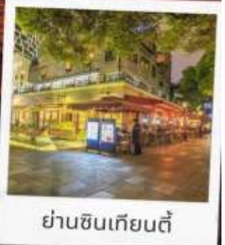
ย่านซินเทียนตี้