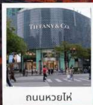
ถนนหวยไห่