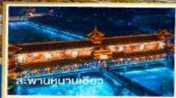
ส.พานหนานเฉียว