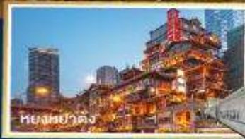
หยงหย่าตง