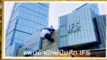
แพนด้ายักษ์บนตึก IFS