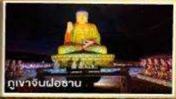
ภูเขาจินฝอชาน