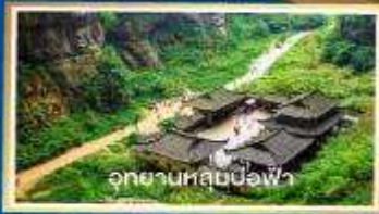
อุทยานหลุมฝังศพ