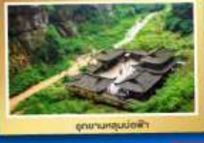
อุทยานนกยูงน้อยฟ้า