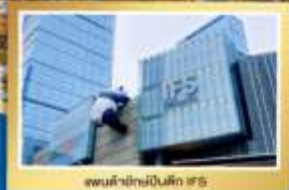
พรมฟ้าใหม่เป็นมิตร ๙๖