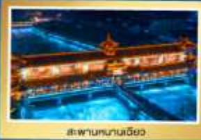
สะพานเทียนเฉียว