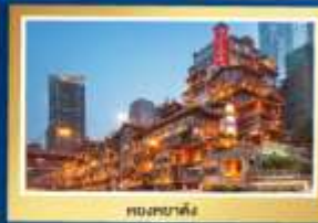
ตองชยาตั้ง