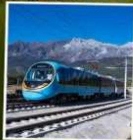
รถไฟชมวิวย ภูเขาหิมะมังกรหยก