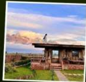
YUN DI AN CAFE