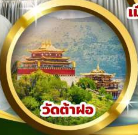
วัดต้าฝอ