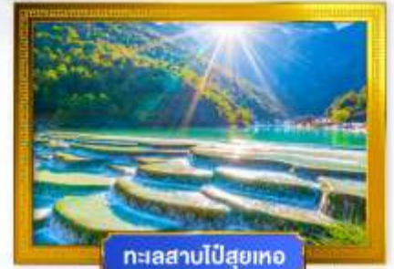
ทะเลสาบไป๋สฺยเหอ