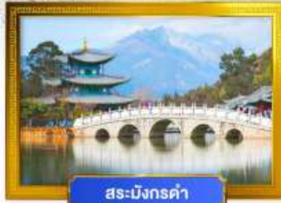
สระมังกรดำ