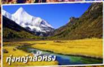
ทุ่งหญ้าสีทอง