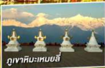
ภูเขาหิมะเหมยลี่