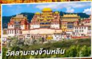
วัดลามะชงจ้านหลิม