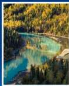
ทะเลสาบมังกรหลับ