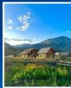
หมู่บ้านเหมอมู่ซุน