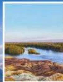
ธารน้ำ 5 สี