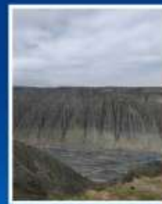
แกรนด์แคนยอน ตู้ซานจื่อ