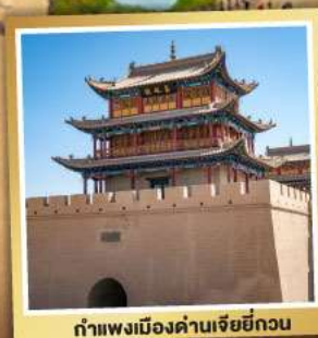
กำแพงเมืองด่านเจียหยี่กวน