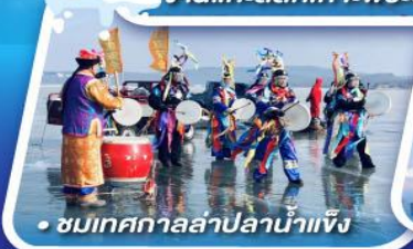
• ชมเทศกาลสาปปลาน้ำแข็ง