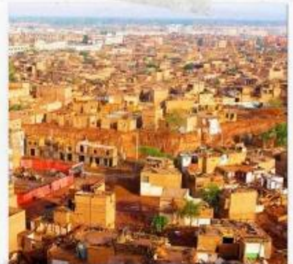
เมืองคาสือ