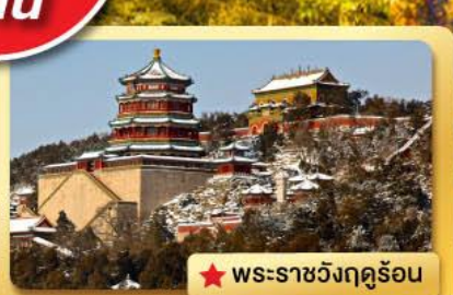
★ พระราชวังฤดูร้อน