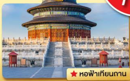
★ หอฟ้าเทียนถาน