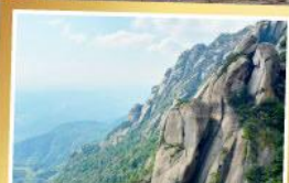
เทามิ่งซาน