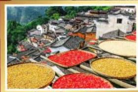
นั่งรถเข็นชมหมู่บ้านหวงหลิง