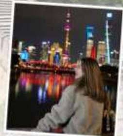
เซี่ยงไฮ้ คลาสสิก ไนท์