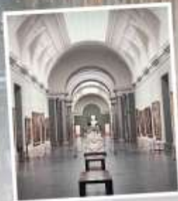
PUDONG ART MUSEUM