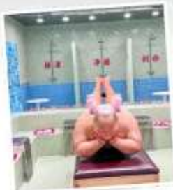
คาเฟ่ผ่อนคลายเหอผิง