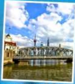
สะพานไว๋ปายตุ้เจียว