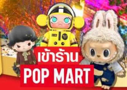
เข้านาน POP MART