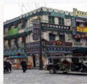
ถนนคนเดินกวางโจว