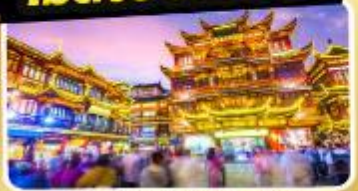
ตลาดร้อยปีเจิ้งหวงเหมียว