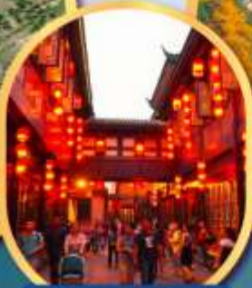
ถนนโบราณจีนหลี