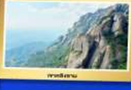
เขาเทียนชาน