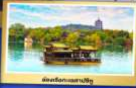
เมืองริ่งกวงเซาเป่ย์