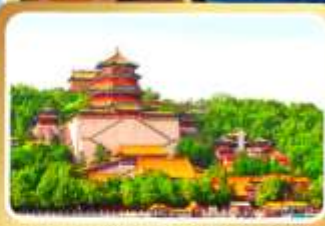
พระราชวังฤดูร้อนอี่เหอหยวน