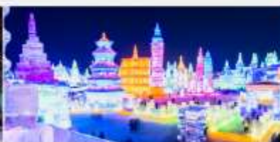
เทศกาลคอมไฟน้ำแข็ง