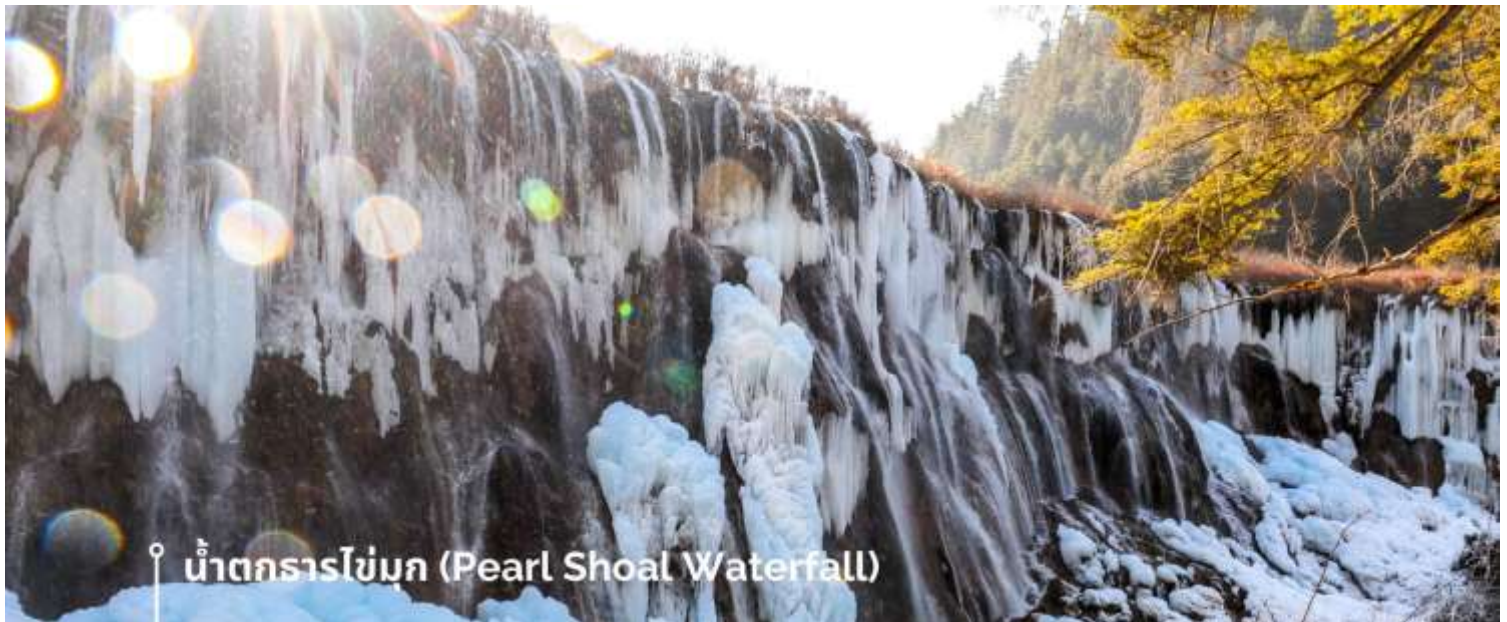
น้ำตกธารไข่มุก (Pearl Shoal Waterfall)

หรือ น้ำตกบูริออลาง (Nuo Ri Lang Waterfall) ถือเป็นน้ำตกที่ใหญ่ที่สุดในจิวจ้ายโกว มีความสูง 40 เมตร กว้าง 310