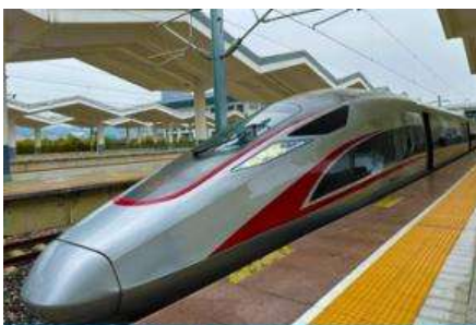
บริการรถไฟความเร็วสูง