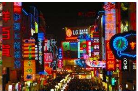
ถนนคนเดินซุบซู่