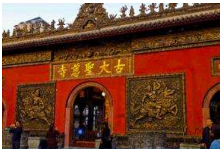
วัดต้าเจี๊ว

พักที่ MAOXIAN INTER HOTEL โรงแรมระดับ 4 ดาวหรือเทียบเท่าในเมืองเม่าเจียน