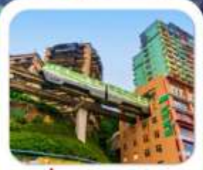
"นั่งรถไฟทะเลสาบ"