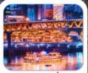
"ล่องเรือชมฉงชิ่ง"