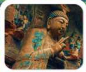
"มรดกโลกผาหินแกะสลักต้าจู้"