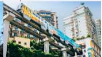
รถไฟฟ้าทะเลสาบ

*ทางบริษัทฯ ขอสงวนสิทธิ์ในการสลับโปรแกรมทัวร์ตามความเหมาะสมขึ้นอยู่กับสถานการณ์ปัจจุบัน โดยคำนึงถึงผลประโยชน์ของลูกค้าเป็นหลัก