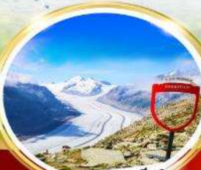
อาเล็กซารีนา