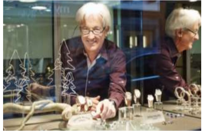
Highlight! สวิตเซอร์แลนด์เป็นผู้ผลิตนาฬิกาชั้นนำของโลก ใช้มาตรฐานการผลิตเข้มงวด วัสดุคุณภาพสูงสุด ผ่านการทดสอบอย่างละเอียด หากคุณกำลังมองหานาฬิกา ที่สวิสเป็นตัวเลือกที่สมบูรณ์แบบ 👍

เช้า 📌 รับประทานอาหารเช้า ณ โรงแรม (เมื่อที่9) จากนั้นนำท่านเดินทางสู่ เมืองซุก (ZUG) ประเทศ สวิตเซอร์แลนด์ (ระยะทาง 32 กม. / 30 นาที) เป็นเมืองที่ร่ำรวยที่สุดในประเทศ และซุกเป็นเมืองที่ติดอันดับหนึ่งในสิบของโลกเมืองที่สะอาดที่สุด นำท่านถ่ายภาพกับ หอนาฬิกา Zyturm เป็นหอคอยสูง 52 เมตรที่มีหลังคาที่มีลวดลายโดดเด่นเป็นสีฟ้าขาว และนาฬิกาที่ตั้งอยู่เป็นนาฬิกาดาราศาสตร์ ที่สามารถบอกข้างขึ้นข้างแรมของพระจันทร์ บอกวันในสัปดาห์ได้ด้วย อิสระ-ช้อปปิ้งที่ Lohri AG Store ที่มีนาฬิกาชั้นนำระดับโลกให้ท่านเลือกซื้อเลือกชม อาทิ เช่น Patek Philippe, Franck Muller Cartier , Piaget, Parmigiani Fleurier, Panerai, IWC , Omega, Jaeger-LeCoultre, lancpain, Tag Heuer ฯลฯ