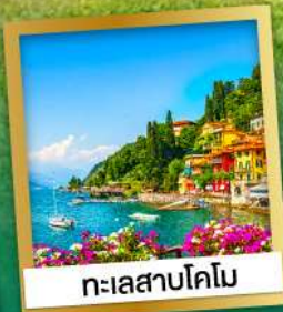
ทะเลสาบโคโม