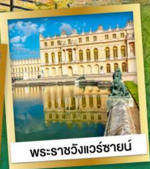
พระราชวังแวร์ซายน์