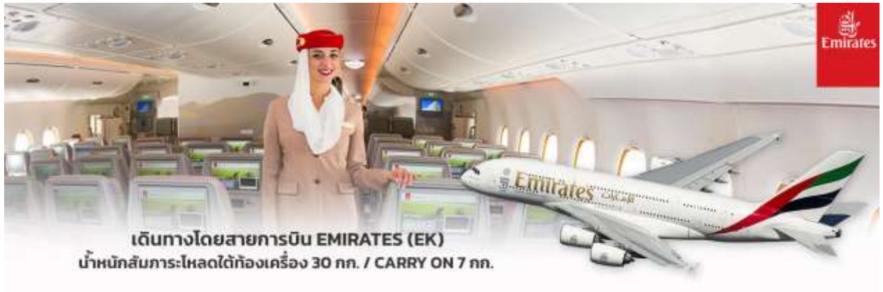
เดินทางโดยสายการบิน EMIRATES (EK) น้ำหนักสัมภาระ:โหลดใต้ท้องเครื่อง 30 กก. / CARRY ON 7 กก.