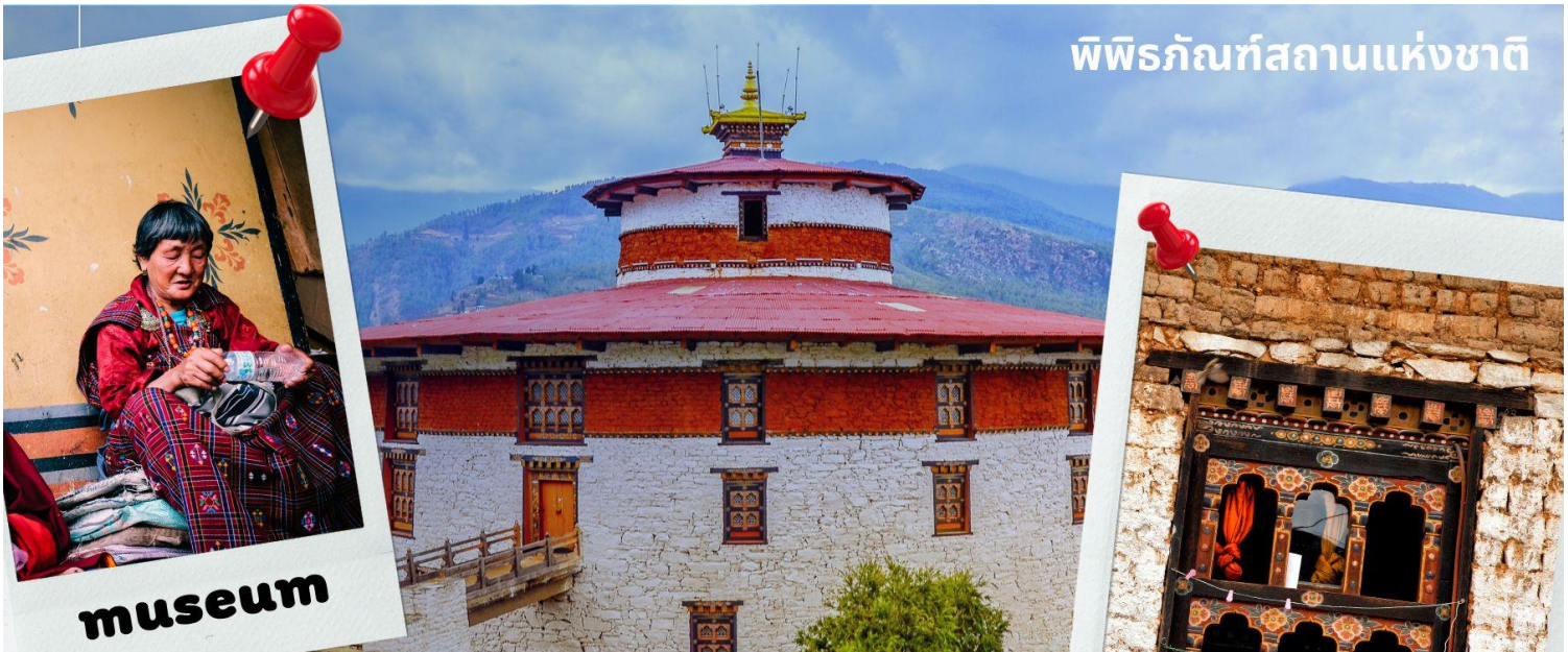
พิพิธภัณฑสถานแห่งชาติ

นำท่านเดินทางไม่ไกล ชม พิพิธภัณฑสถานแห่งชาติ พิพิธภัณฑสถานแห่งนี้เป็นที่เก็บรวบรวมหน้ากากศิลปะแบบพุทธ มหายาน นิกายตันตระ ภาพพระบฏ อาวุธ เหริยญกษาปณ์ เครื่องมือเครื่องใช้ไม้สอยต่างๆ รวมถึงจัดแสดง ความ หลากหลายทางธรรมชาติอันสมบูรณ์ของประเทศเพื่อให้ทุกท่านได้รู้จักภูฏานมากขึ้น ตรงข้ามกับอาคารพิพิธภัณฑ เป็น อาคารทรงกลมสีขาว เรียกว่า ตาซอง (Ta Dzong) หรือ หอคอย เดิมใช้เป็นหอสังเกตการณ์เข้าศึกศัตรูเนื่องจาก