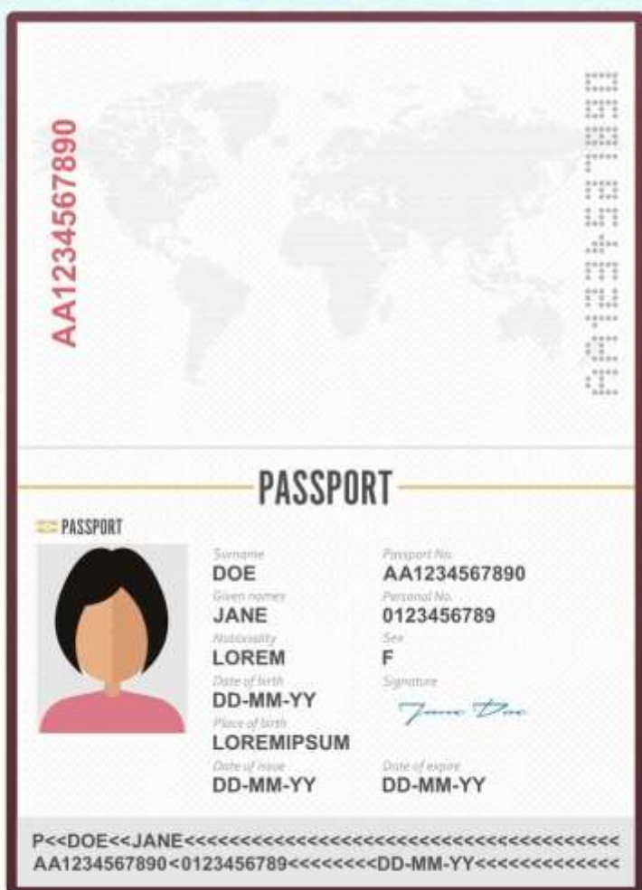
ตัวอย่างไฟล์สแกน รูปถ่าย