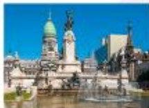
ชมเมืองบัวโนสไอเรส

23.55 น. ออกเดินทางสู่สนามบินอีสตันบูล เพื่อการบิน TK16