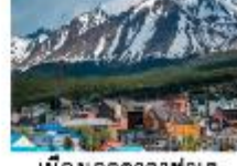
เมืองเอลคาลาฟาเต

** พักที่ Xelena Hotel 4* หรือเทียบเท่า **