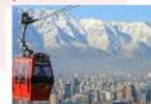
นั่งกระเช้าขึ้นสู่เนินเขาซานต้า ลูเซีย