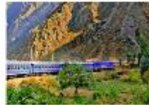
รถไฟขบวนพิเศษ Vistadome