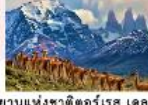
อุทยานแห่งชาติตอร์เรส เดล เพน