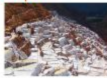
เหมืองเกลือโบราณ