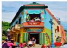
เมืองบัวโนสไอเรส

xx.xx น. ออกเดินทางสู่กรุงบัวโนสไอเรส เพื่อการบิน... xx.xx น. เดินทางถึงสนามบินบัวโนสไอเรส ประเทศอาร์เจนตินา