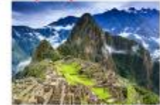
เมืองมาชู ปิกชู

** พักที่ Sonesta Cusco Hotel 4* หรือเทียบเท่า **