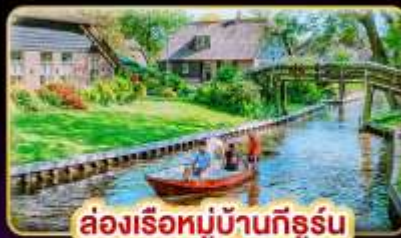
ล่องเรือหมู่บ้านกังหัน