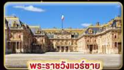
พระราชวังแวร์ซาย